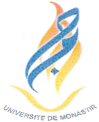
UNIVERSITE DE MONASTIR